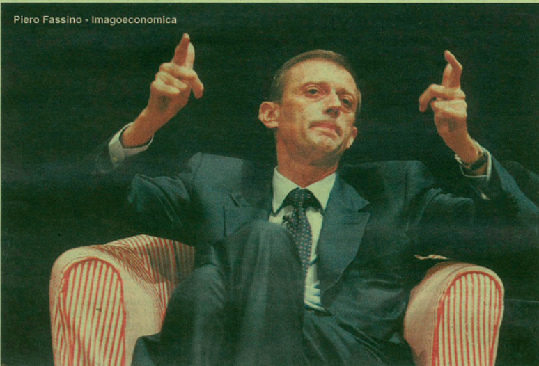
Piero Fassino